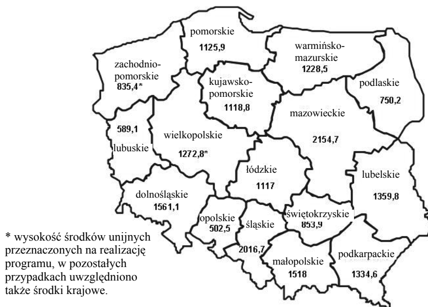
Rysunek 2. Alokacja środków w ramach Regionalnych Programów Operacyjnych według województw (mln euro)