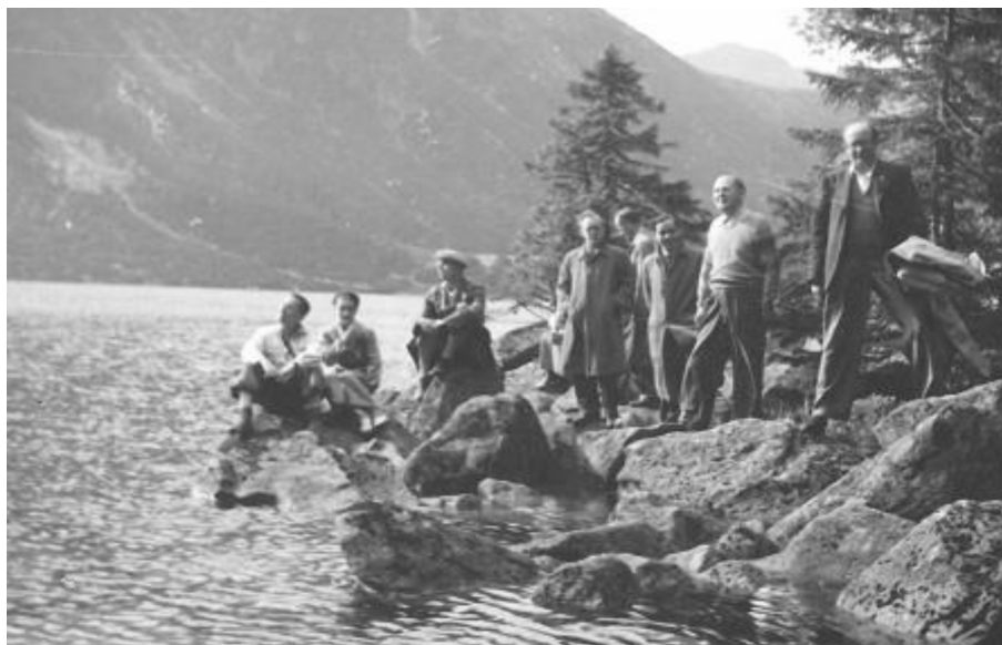
Fotografia 2. Misja brytyjskich ekonomistów nad Morskim Okiem

Przed nami było jeszcze wiele lat eksperymentowania z gospodarką centralnie sterowaną. Czy to zaproszenie było jakąś pomyłką ówczesnych władz Polski Ludowej? Zapewne nie była to pomyłka. Sam skład delegacji brytyjskiej na to nie wskazuje. Co więcej, wizyta była pożądana z obu stron. Już sam fakt, że przybywający do Polski ekonomiści byli zwolennikami teorii Keynesa, a niektórzy wykładowcami ekonomii marksistowskiej w Wielkiej Brytanii, wiele wyjaśnia. Keynesizm 4 w pewnym sensie przeciwstawia się ekonomii liberalnej. Wskazuje między innymi na to, że wolny rynek nie ma zdolności do samoregulacji, a interwencja państwa w gospodarkę jest niezbędna. Wśród wielu idei warto podkreślić stanowisko, że bezrobocie jest pochodną niedostatecznego popytu. Keynesizm musiał więc wydawać się kuszącą teorią komunistycznym władzom Polski. Z drugiej strony, dla keynesistów ówczesne państwa demokracji ludowej mogły stanowić niezmiernie, niebywałe, żywe laboratorium dla obserwowania skutków wbudowywania interwencjonizmu państwowego w mechanizm rynkowy. Obie strony musiały więc być żywotnie zainteresowane tą wizytą.