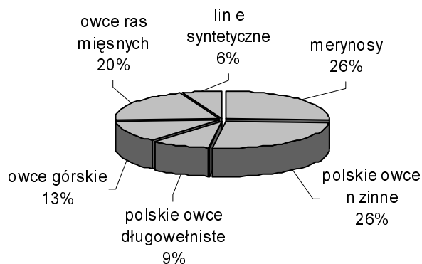
Rysunek 3. Struktura rasowa użytkowanego pogłowia owiec w 2004 roku

Zmiana liczebności owiec była skorelowana dodatnio ze wsparciem gospodarstw owczarskich w postaci dotacji. W latach 1997-2006 rolnicy otrzymywali dotację z Funduszu Postępu Biologicznego, a w kolejnych latach tzw. płatności za ważenie ze środków przekazywanych Polskiemu Związkowi Owczarskiemu. W tabeli 2 zestawiono stawki dotacji do owcy matki w różnych rodzajach stad owiec. Stada ojcowskie zajmowały się odchovem tryków (reproduktorów), zaś mateczne