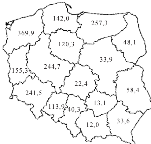
Rysunek 1. Grunty Zasobu ogółem w dzierżawie według stanu na 31.12. 2006 [tys. ha]

Źródło: Rynek ziemi rolniczej – stan i perspektywy. 2007.